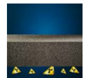
Bescherming tegen radon