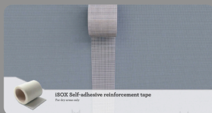
iSOX Self-adhesive reinforcement tape

High and setting elasticity Good adhesion Sealing joints